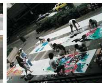
大众可免费欣赏一连串的艺术作品及活动, 并与作者交流

去年, 东陵购物中心开创了新加坡第一条艺术街, 也同时以轻松户外感觉为背景为艺术家和观赏家搭起了互相学习和分享创作灵感的桥梁。