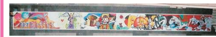
该艺术街提供免费场所, 吸引了各个艺术学院及画廊的艺术家来呈献一系列别开生面的艺术作品。主办单位希望公众能透过这次一连串多姿多彩的表演及儿童工作坊了解到艺术是可以以轻松的方式去呈现, 欣赏及陶醉其中。

有许多艺术家的作品甚至第一天就赢得了属于它们的知音。该艺术街在去年得到了相当多的回响。今年东陵购物中心以推广新加坡本地文化艺术及鼓励本地人才为目标, 再次举办颇具意义的活动。